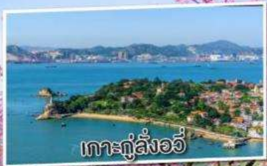
เกาะกู่ลิ่งอวี่