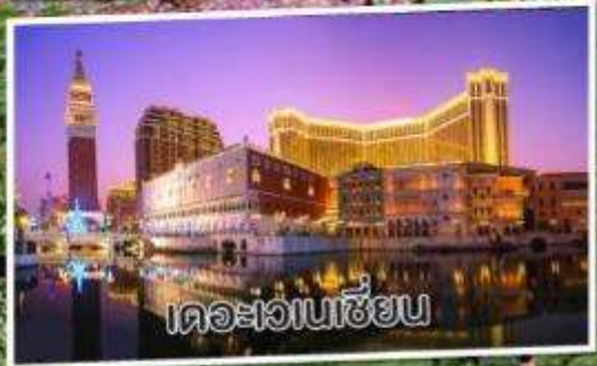
เดอะเวเนเซียน