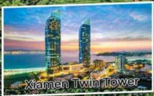
Xiamen Twin Tower