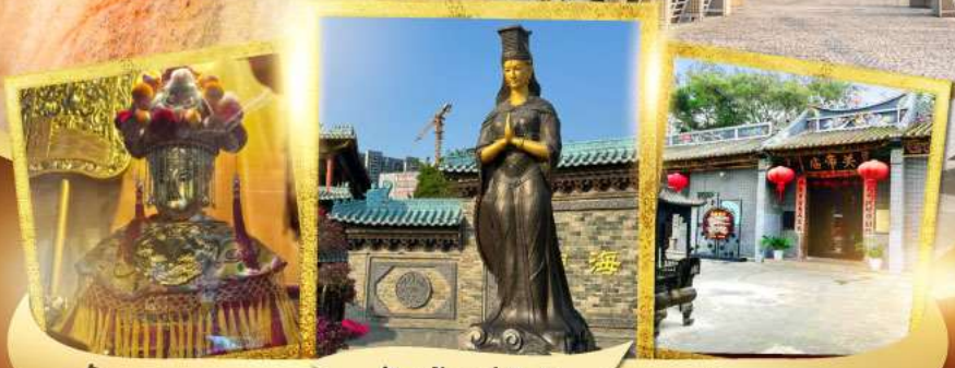
วัดอาม่า