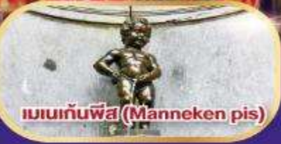
แมนกันพีส (Manneken pis)