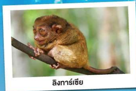
ลิงทาร์เซียร์