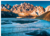
สะพานแขวนอุสโซนิ