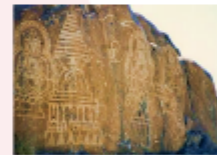
เมืองซีลาส