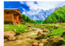
ยอดเขานังกาพาร์บัด