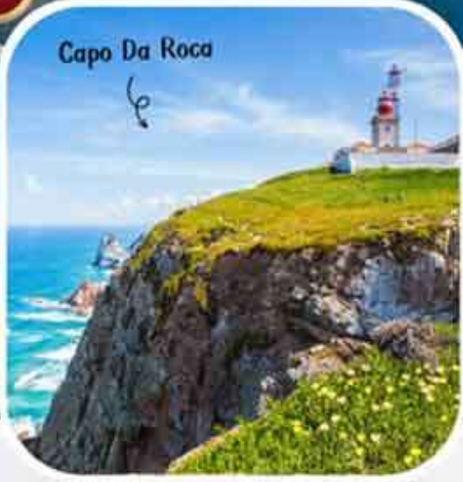
Capo Da Roca