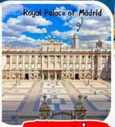
Royal Palace of Madrid