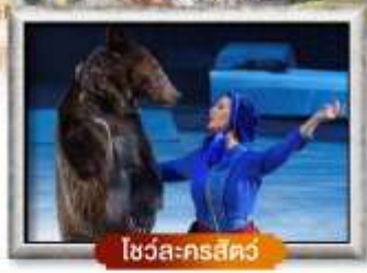
โซวโลครสกีว