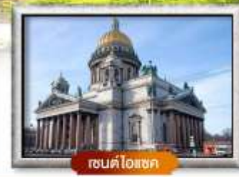
เซนต์โอสเตก