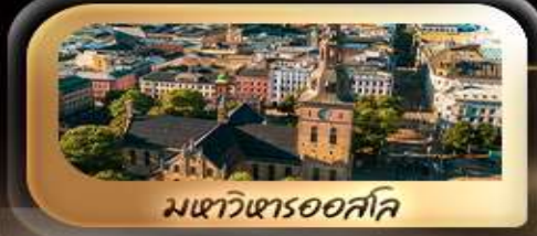
มหาวิหารออสโล