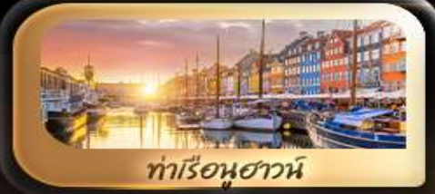
ท่าเรือฮาวน์