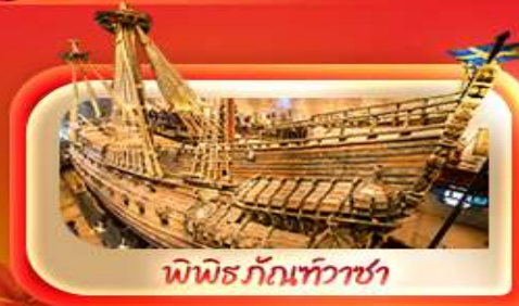
พิพิธภัณฑ์ท้าวชา