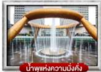
น้ำพุแห่งความมั่งคั่ง