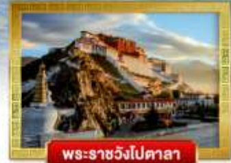
พระราชวังโปตาลา