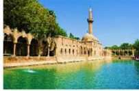
ถ้ำอับราฮัม