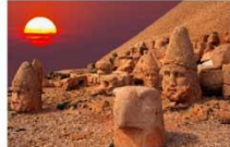
ชมพระอาทิตย์ตกดิน