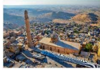
เมืองมาร์ดิน

**ที่พักรที่ KAYA NINOVA MARDIN HOTEL **