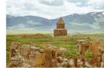
เมืองเอนิชม

15.25-17.50 น. เหน็จพักกลับสู่อิสตันบูล โดยสายการบิน TURKISH AIRLINES เที่ยวบินที่ TK 2717 (บินภายในประเทศ)