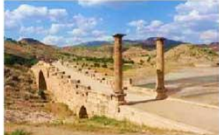
สะพานเซเวอร์ริน