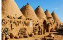
บ้านแบบรวงผึ้ง