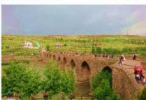
สะพานสิบโค้ง