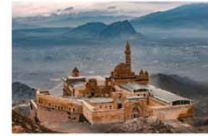
พระราชวังอิซฮาก พาชาร์