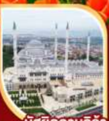
มัสยิดคามลิก้า