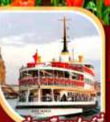
ล่องเรือเฟอร์รี่