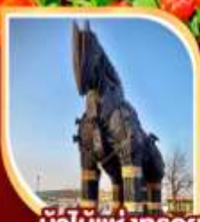
น้ำไม้แห่งทรอย