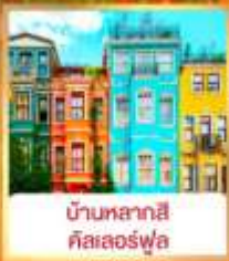
บ้านหลากสี คิสเลอร์ฟู