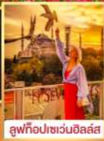
ลู่ฟือปเซเวนฮิลล์ส