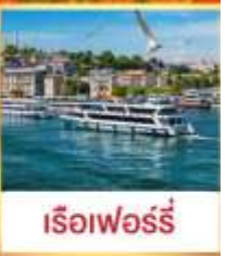
เรือเฟอร์รี่