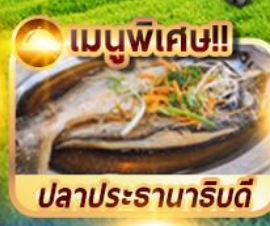
เมนูพิเศษ!! ปลาประรานาธิบดี