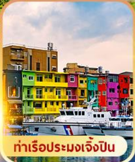
ท่าเรือประมงเจิ้งปิ่น