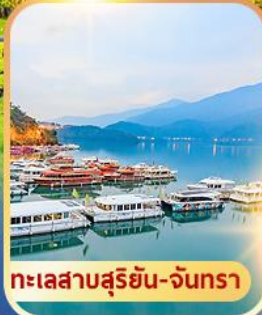
ทะเลสาบสุริยอัน-จันทรา