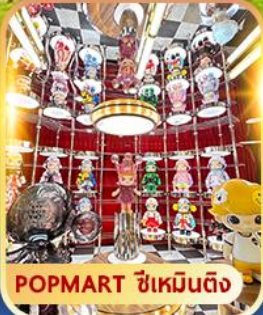
POP MART ซีเหมินตึง