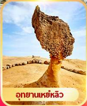
อุทยานเหย์หลิว