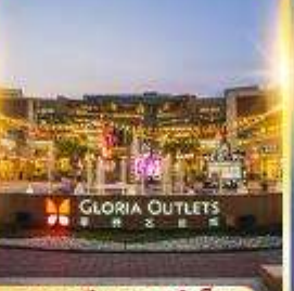
กลอเรีย เอาท์เล็ต