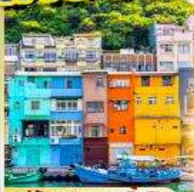
หมู่บ้านประมงเงินปิง