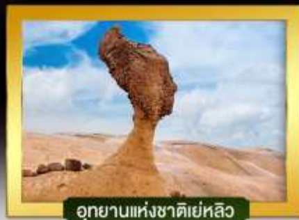
อุทยานแห่งชาติเย่หลิว