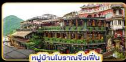
หมู่บ้านโบราณจิวเฟิน