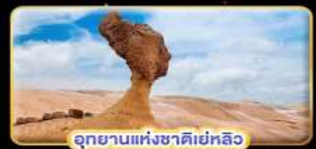
อุทยานแห่งชาติเยลโลว์