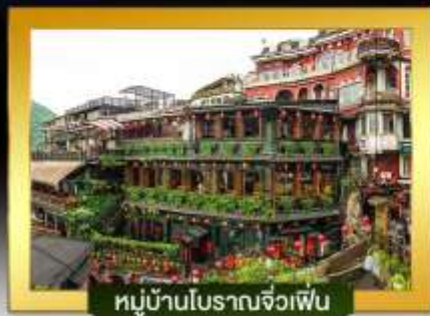
หมู่บ้านโบราณจิวเฟิน