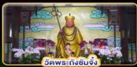
วัดพระถังซำจั๋ง

"ล่องเรือทะเลสาบสุริยันจันทรา" ขอความรักวัดหลงซาน