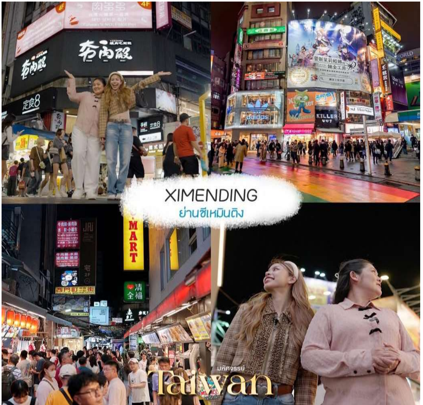
XIMENDING ย่านซีเหมินติง