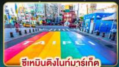
ซีเหมินติงไนท์มาร์เก็ต