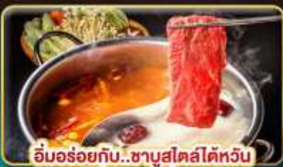
อิ่มอร่อยกับ..ชาบูสไตล์ไต้หวัน เมนูหม้อไฟจิ๋วพรีเมียม เสียวหลงเป่า