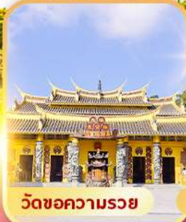
วัดขอความรอย