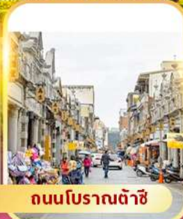
ถนนโบราณต้าซี