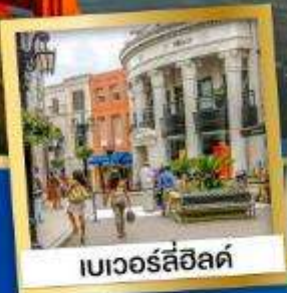
เบเวอร์ลี่ฮิลล์