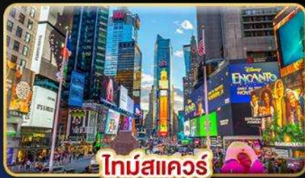
ไทม์สแควร์