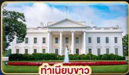
ทำเนียบขาว