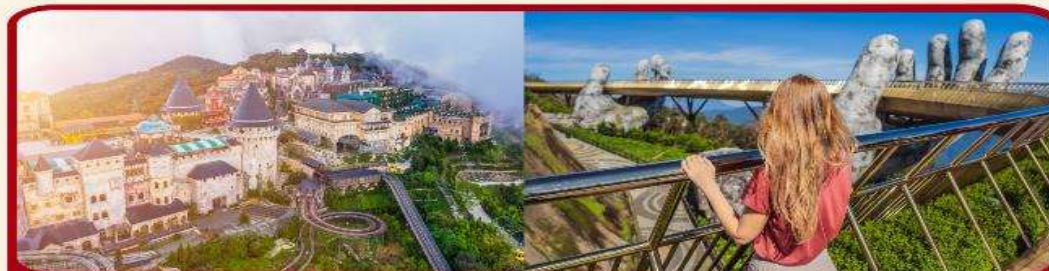
เที่ยวบานาฮิลล์เต็มวัน แบบจุใจ