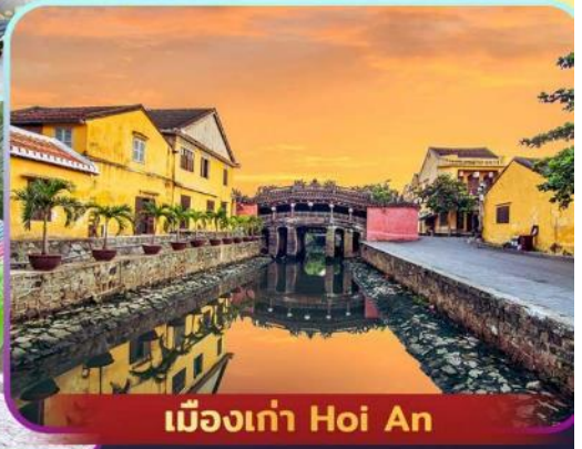
เมืองเก่า Hoi An