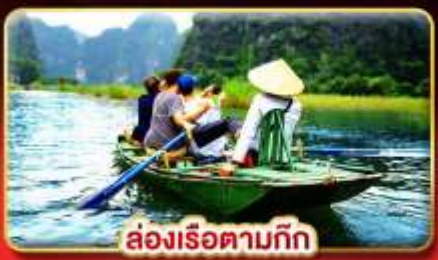
ล่องเรือตามก๊ก