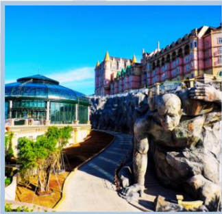
โซอู Eclipse Square