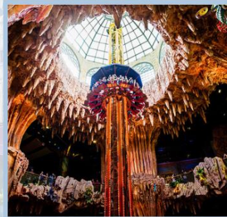
สวนสนุก Fantasy Park