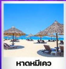
หาดหมีคว