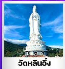
วัดหลินอึ้ง