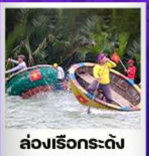
ล่องเรือกระดัง