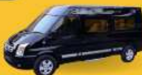
VAN (7-8 ท่าน)