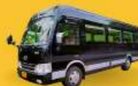
BUS (10-18 ท่าน)