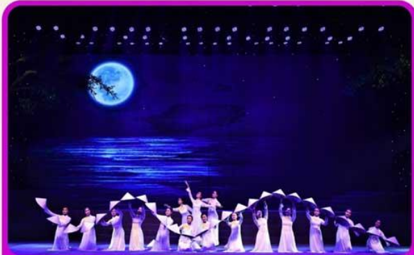
ชมการแสดง Charming Show Danang