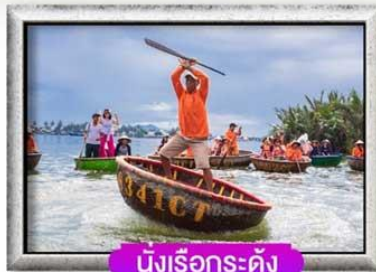
นั่งเรือกระดัง