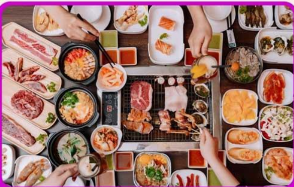
พิเศษ!! เมบิวซาซิมิ+บุฟเฟ่ต์ปิ้งย่าง