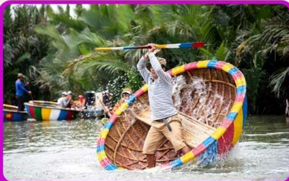
พิเศษ !!! นั่งเรือกระดัง UNSEEN เวียดนาม