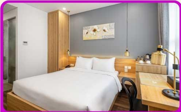
พักเมืองดานัง 4 ดาว 2 คืน