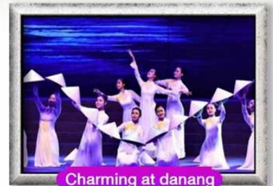
Charming at danang