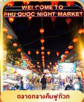
ตลาดกลางคืนฟู๊ควัก