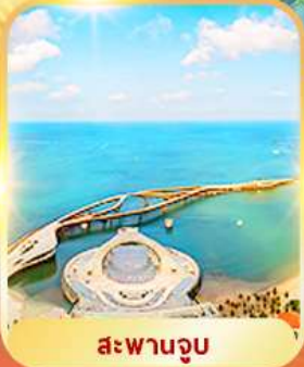
สะพานจวบ