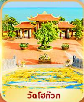
วัดโฮก๊วก