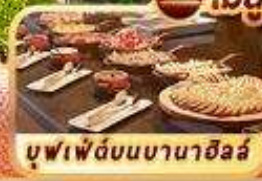
บุฟเฟ่ต์บนบานาฮิลล์