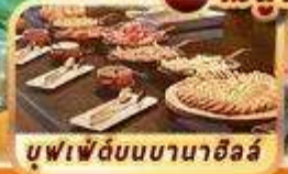
บุฟเฟ่ต์บนบานาฮิลล์