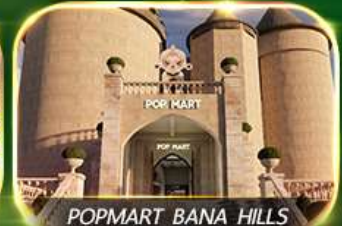
POPMART BANA HILLS

สัมผัสความงามหมู่บ้านฝรั่งเศสที่บานาฮิลล์ ช้อปปิ้ง POPMART เยือนเมืองโบราณฮอยอัน ล่องเรือกระดิง วัดหลินอึ้ง สะพานมังกร