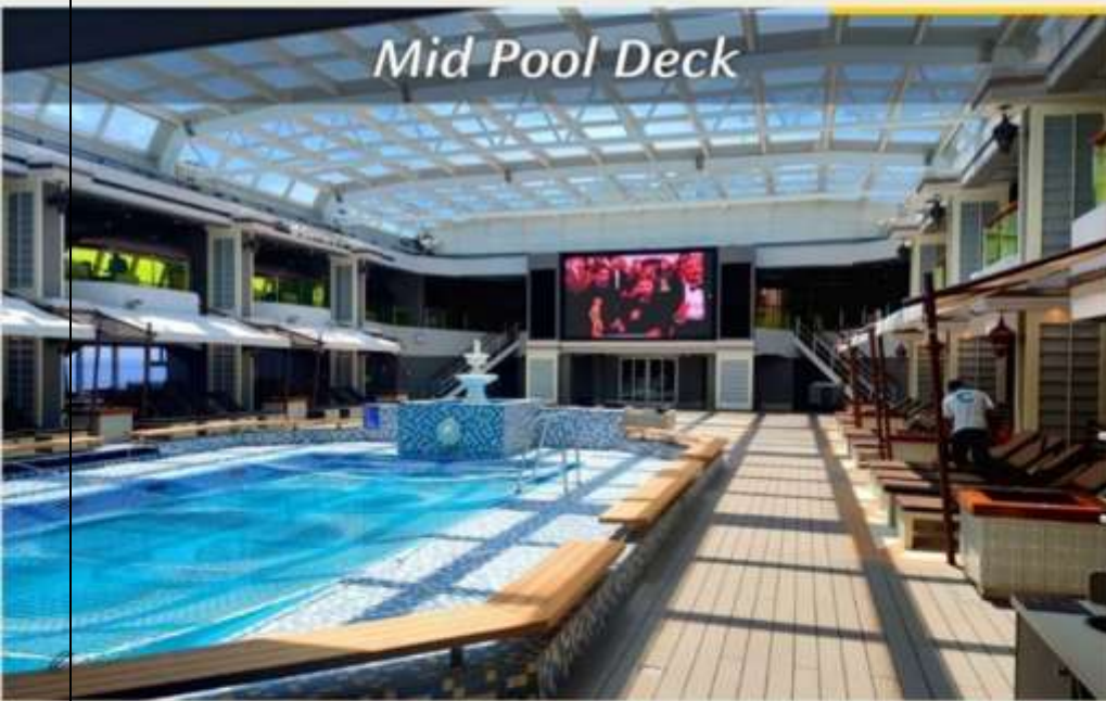
Mid Pool Deck