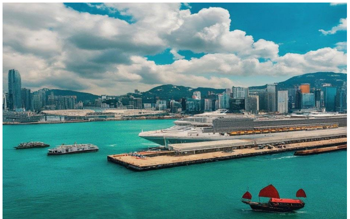
Spectrum Of The Sesa – QQCRHKG-RCI032 – (HONG KONG 5D4N) – (CRUISE ONLY)

วันแรกของการเดินทาง ทุกท่านควรเดินทางมาถึงท่าเรือ Hong Kong - Kai Tak Cruise Terminal, 33 Shing Fung Road, Kowloon, HongKong. เพื่อทำการเช็คอินก่อนอย่างน้อย 3 ชั่วโมงก่อนเรือออก จาก สนามบินนานาชาติ เซ็กลัปก๊อก เดินทางโดย Taxi มาถึง ท่าเรือใดต่ักใช้เวลาประมาณ 1 ชม